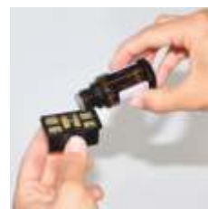
Z dozownikiem zapachu

Nie ma lepszego nawilżacza powietrza od Oskara! Ten oszczędny typ, pełen mocy, zapewniający idealny klimat w pomieszczeniu, dzięki wbudowanemu higrostatowi optymalizuje poziom nawilżenia powietrza.