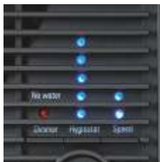
Automatyczny wyłącznik Higrostat i tryb nocny