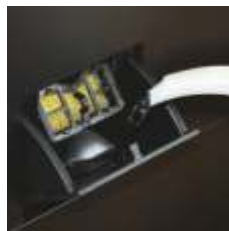
Łatwe dopelnianie w trakcie pracy