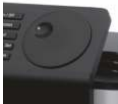
Obrotowy element sterujący