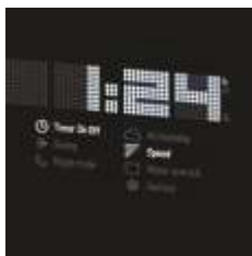
Timer 24 h