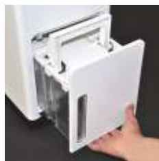
Zbiornik z uchwytem