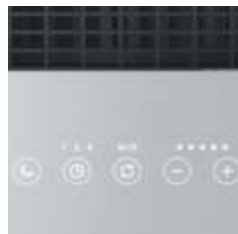
5 poziomów, Tryb Auto, Timer i Tryb nocny